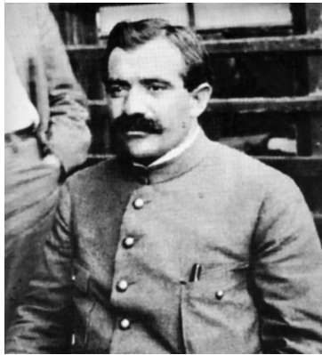
Генерал Пабло Гонсалес

и именно с ним трудящиеся Мексики связывали свои надежды на социально-экономические преобразования. Потеряв руку в битве с Вильей летом 1915 года, он страстно ненавидел последнего, что, по мнению Каррансы, навсегда исключало даже тактический союз этих двух самых популярных мексиканцев того времени.