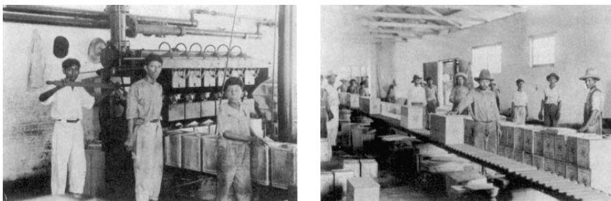
Фабрика нефтяной компании «Эль Агила» в Тампико, 1920 год